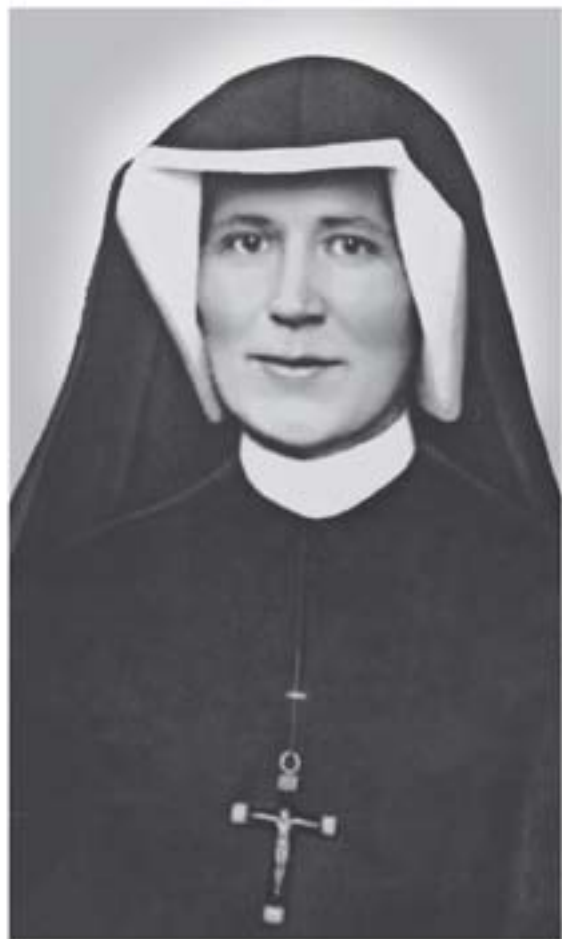
SANTA MARIA FAUSTINA KOWALSKA APOSTOL DE LA DIVINA MISERICORDIA Canonizada el 30 de abril del 2000. Año Santo Jubilar